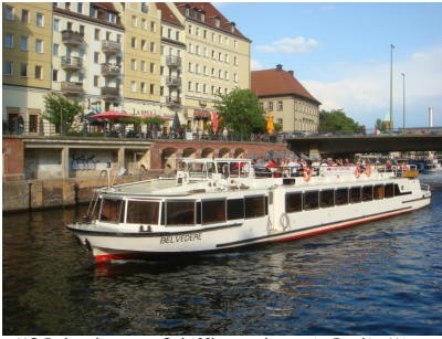
MS Belvedere am Schiffbauerdamm in Berlin-Mitte

Das Salonschiff MS Belvedere gehört zu einer Serie von Fahrgastschiffen (Typ III), die in den Jahren 1977 bis 1992 auf der Yachtwerft Köpenick gebaut wurden. Es ist ein sogenanntes Zwei-Deck-Schiff, mit einem kleinen und großen Salon auf dem unteren Deck und einem großzügigem Sonnendeck.