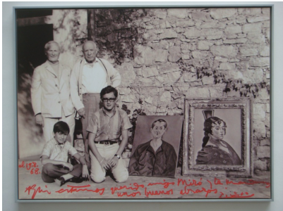
Picasso und Kollegen

Unterhaltsames Lernen - ist das Ziel von The Picasso Story . Zu sehen sind Keramiken, Grafiken und Zeichnungen des Künstlers. Die umfangreiche Fotokunstsammlung von Edward Quinn zeigt Picasso bei der Arbeit, in der Familie, in der Öffentlichkeit. Viele noch unbekannte Fotos sind erstmalig ausgestellt und legen die unterschiedlichen Facetten von Picasso offen. www.ExpoNuevo.de