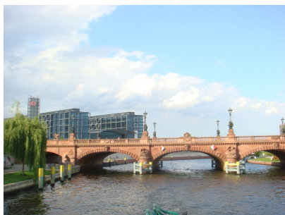
Marschallbrücke und Berliner Hauptbahnhof