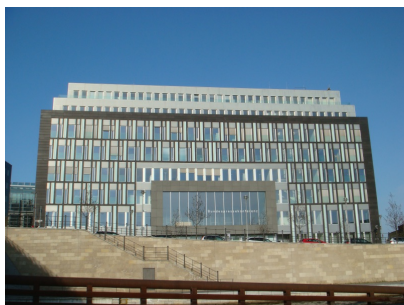
Haus der Bundespressekonferenz