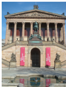
Alte Nationalgalerie Museumsinsel

Anlegestelle „Alte Börse“, Burgstraße, in 10178 Berlin-Mitte, Nähe S-Bahnhof / Tram-Haltestelle „Hackescher Markt“