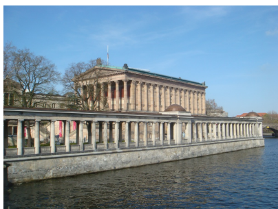
Alte Nationalgalerie vom Wasser aus

Den aktuellen Fahrplan finden Sie hier .