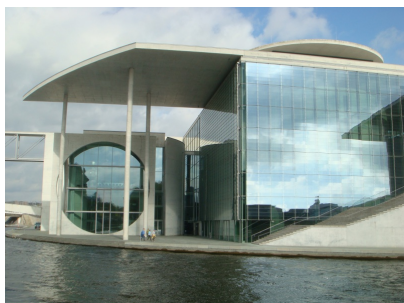
Elisabeth-Lüders-Haus von der Spree aus gesehen

Anlegestelle „Alte Börse“, Burgstraße, in 10178 Berlin-Mitte, Nähe S-Bahnhof / Tram-Haltestelle „Hackescher Markt“